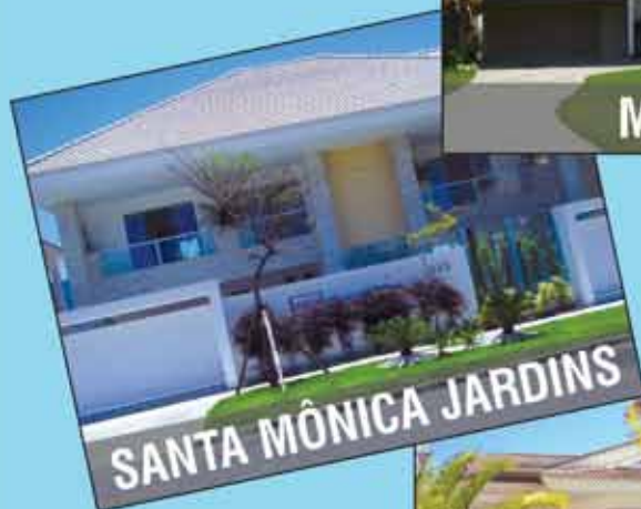
SANTA MÔNICA JARDINS